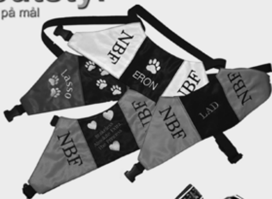
Tjenestetegn etter eget fargevalg og design