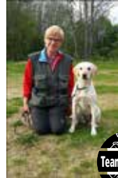
Marit Sunde m/liadens Elefsina Labrador Retriever Reg nr: SE23239/2010 Kjønn: Tispe Nidaros BHK