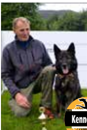
Per Sallaup m/XO Aylar Schäferhund Reg nr: 04496/06 Kjønn: Tispe NSchK avd Møre og Romsdal

TCH 2011 N Bch IP Molars Wiska TCH 2013 med XO Aylar