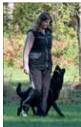
Aina Øverland m/Ulvehiets Back in Black (Vilma) Schäferhund Reg nr: NO48264/10 Kjønn: Tispe NSchK avd Agder

TCH 2012 og 2013 Nr:3 The Challenge 2012