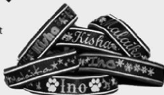
Refleks i 13 forskjellige farger til halsbånd og koppel