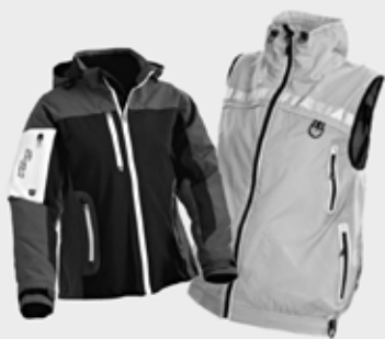
Hundeførerverster og jakker