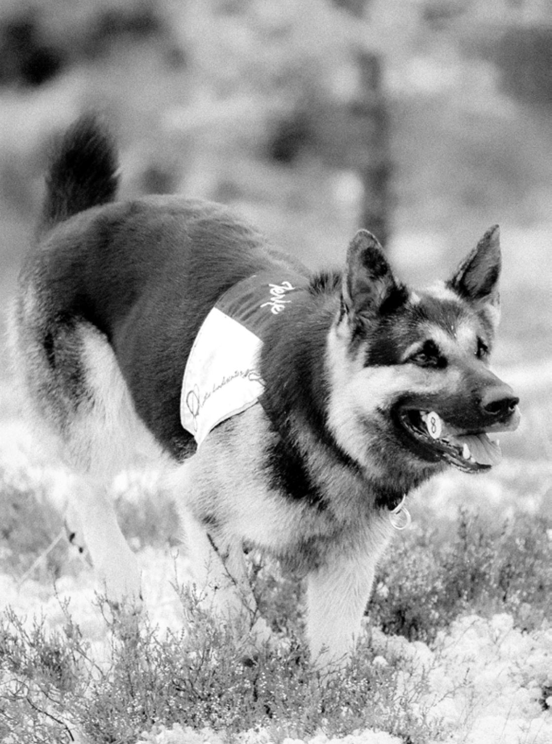
Terje Østlie m/Ariens Bambi (Bono) The Challenge 2013